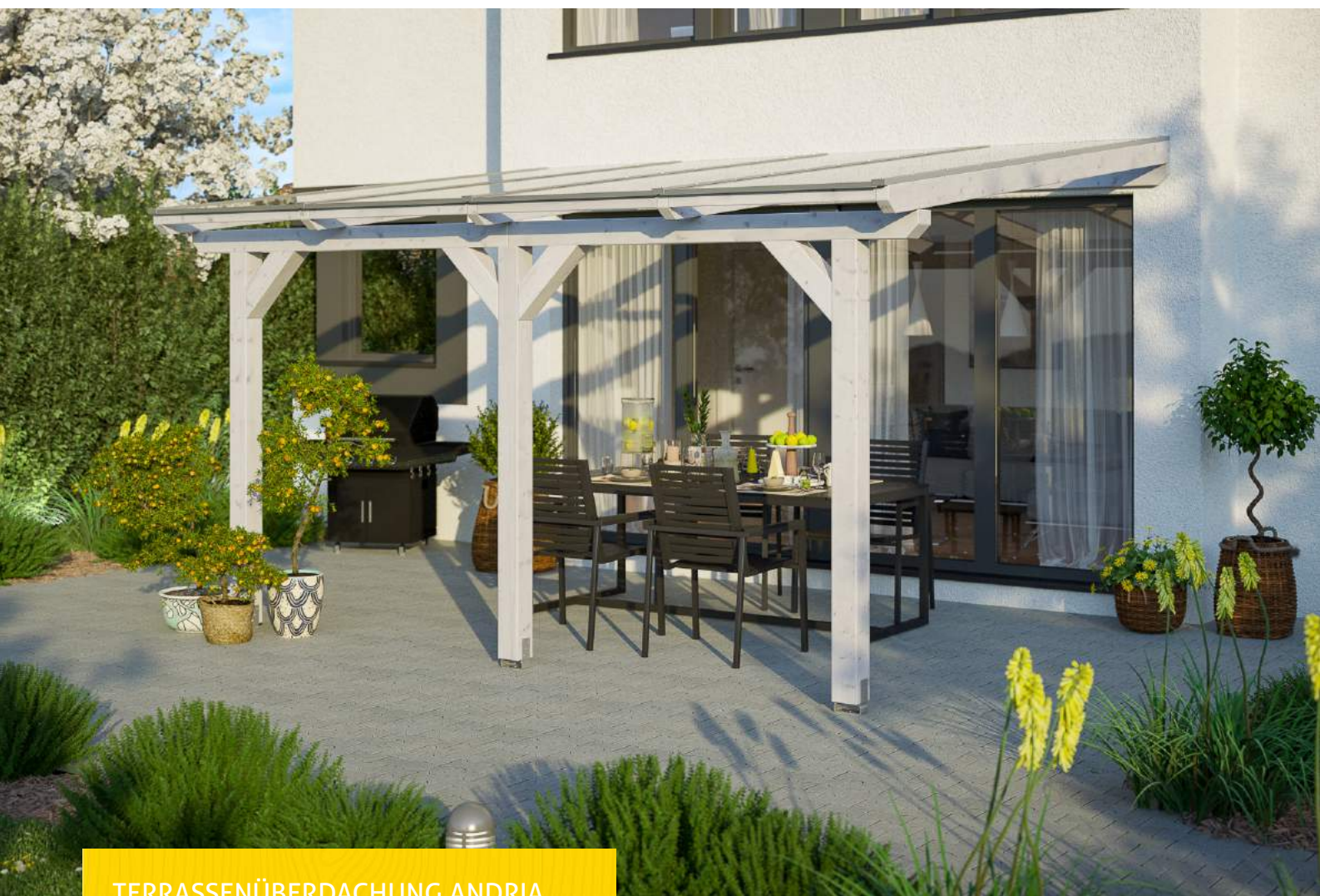
TERRASSENÜBERDACHUNG ANDRIA 434 x 350 cm

Massive Konstruktion aus hochwertigem Leimholz (BSH-Fichte)