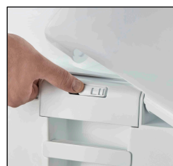
Einfaches Arretieren durch Schiebersystem