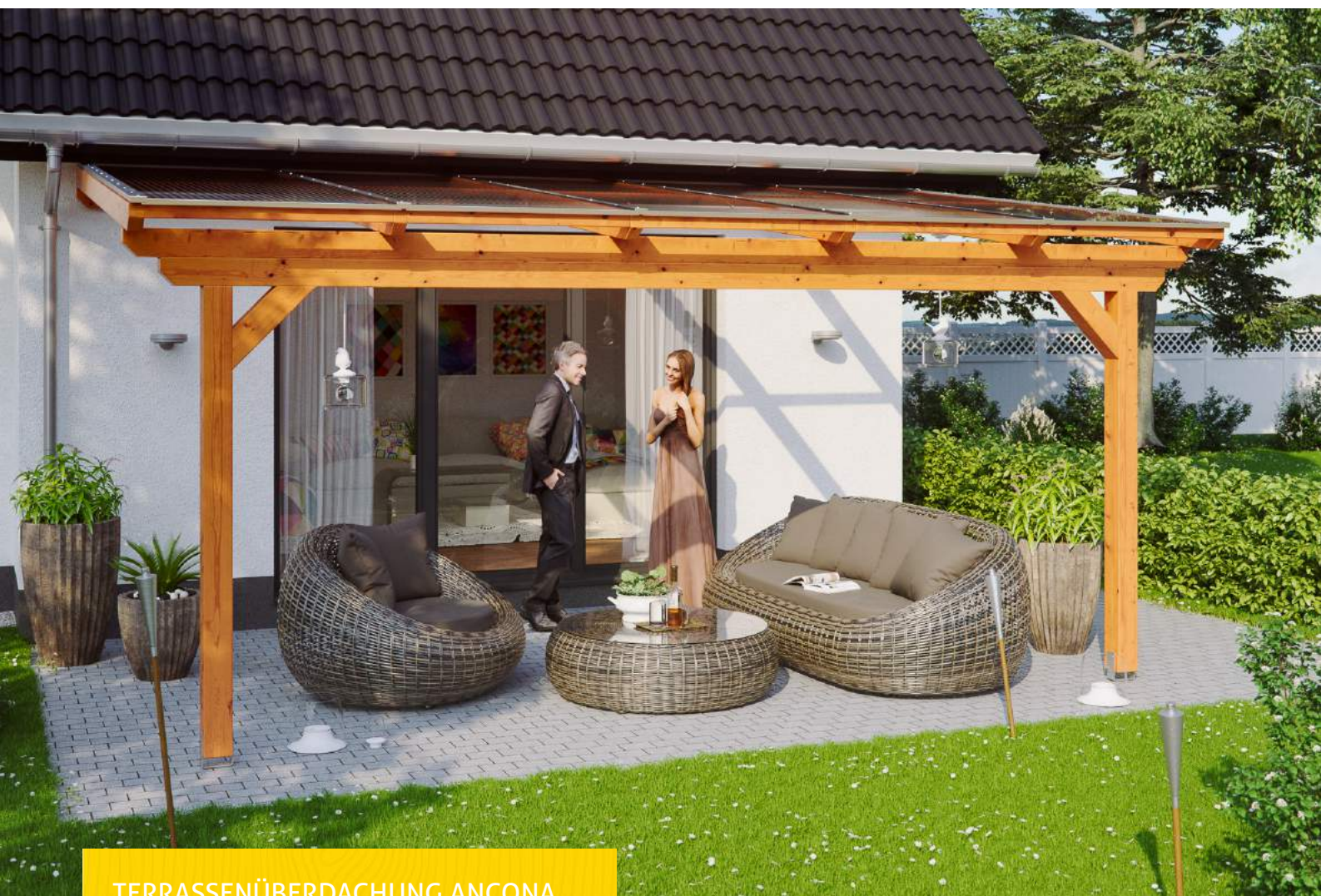
TERRASSENÜBERDACHUNG ANCONA 541 x 350 cm

Massive Konstruktion aus hochwertigem Leimholz (BSH-Fichte)