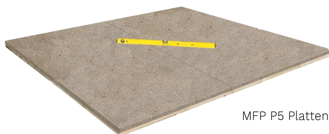
MFP P5 Platten

Fußbodenelemente* von unten behandeln, zusammenlegen, umdrehen und mit einer Wasserwaage ausrichten.