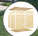
Einfache Elementbauweise Inkl. Fußboden