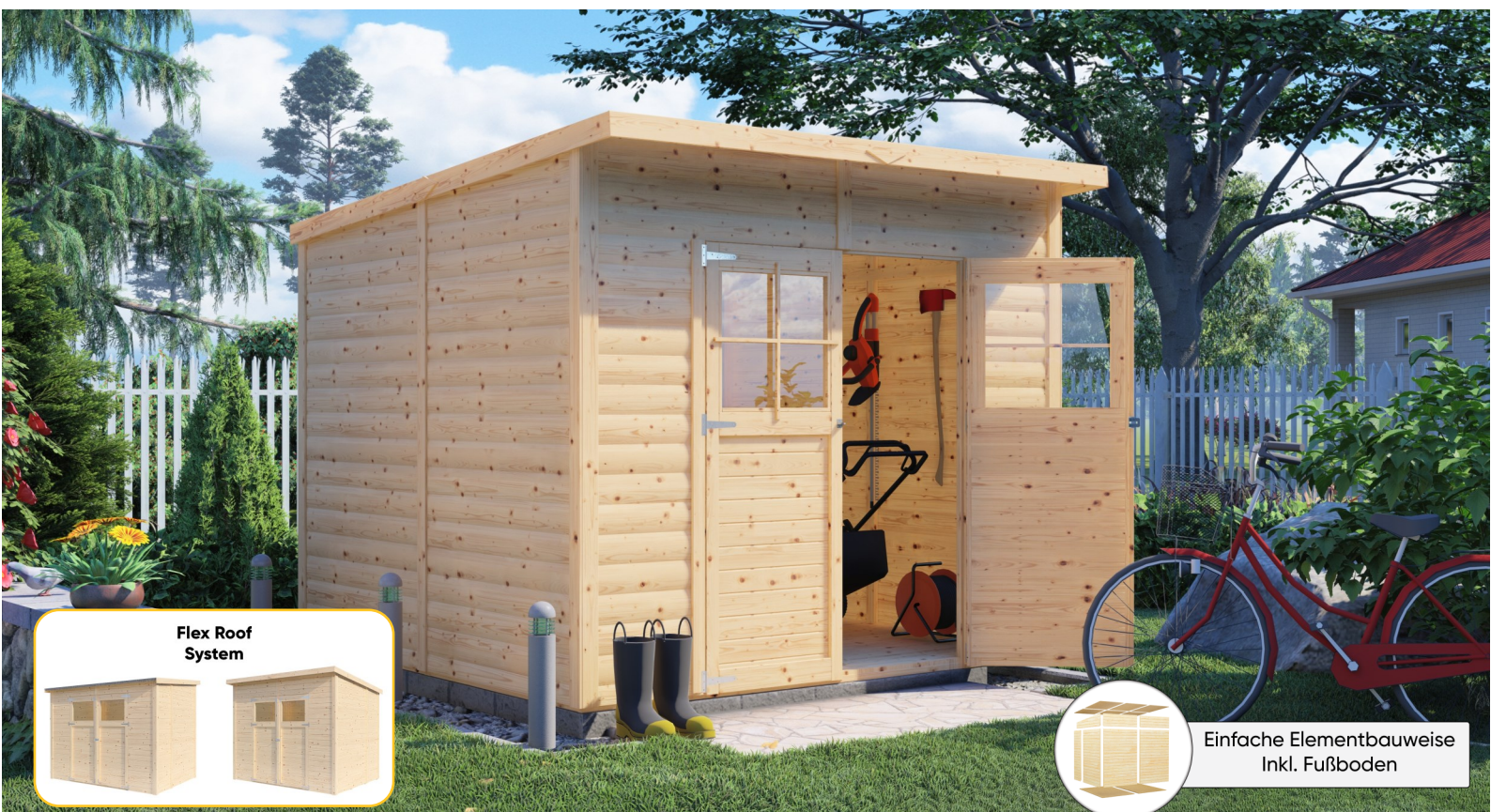
Flex Roof System