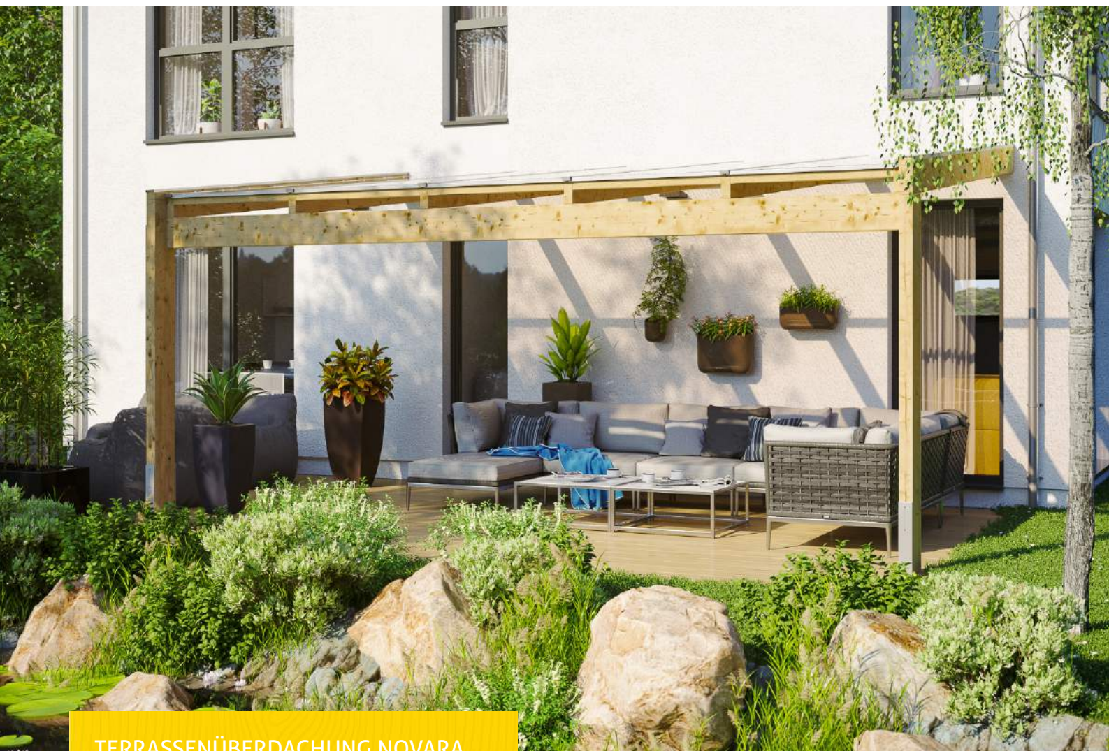
TERRASSENÜBERDACHUNG NOVARA 557 x 359 cm

Massive Konstruktion aus hochwertigem Leimholz (BSH-Fichte)