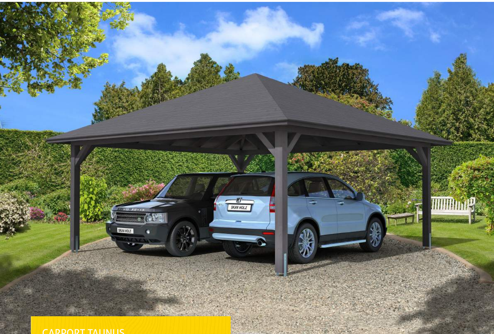
CARPORT TAUNUS 634 x 634 cm