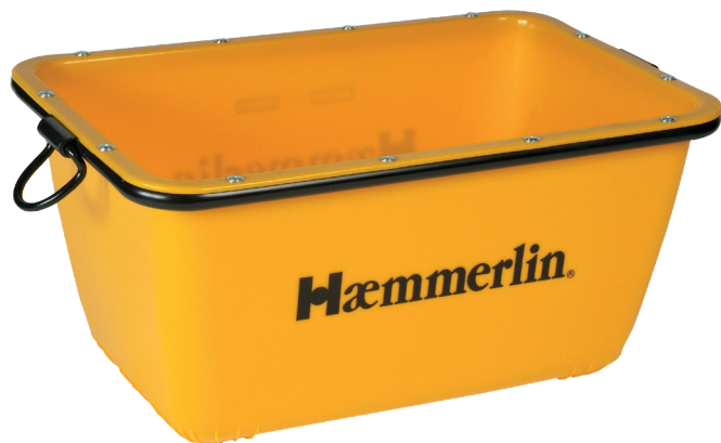
KÜBEL 200 L