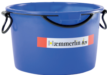
KÜBEL 90 L