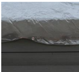
Winterabdeckung Winter cover CIKPCO52