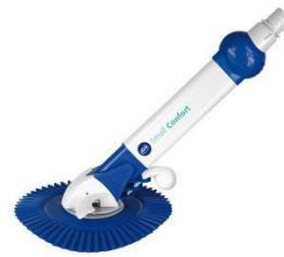
Automatischer Bodenreiniger Automatic cleaner AR20682