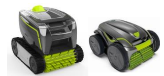
Roboter Robot GT3220/GV3420