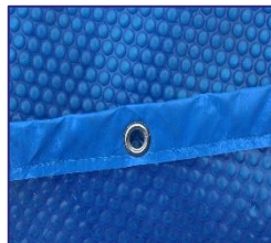
Isothermabdeckplane Isothermic cover CVKPCO52