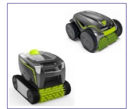
Roboter Robot GT3220/GV3420