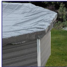
Winterabdeckplane Winter cover CIKPCO52