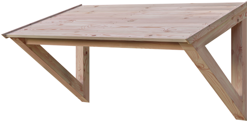
VORDACH POEL 148 x 87 cm

Massive Konstruktion aus hochwertiger Douglasie