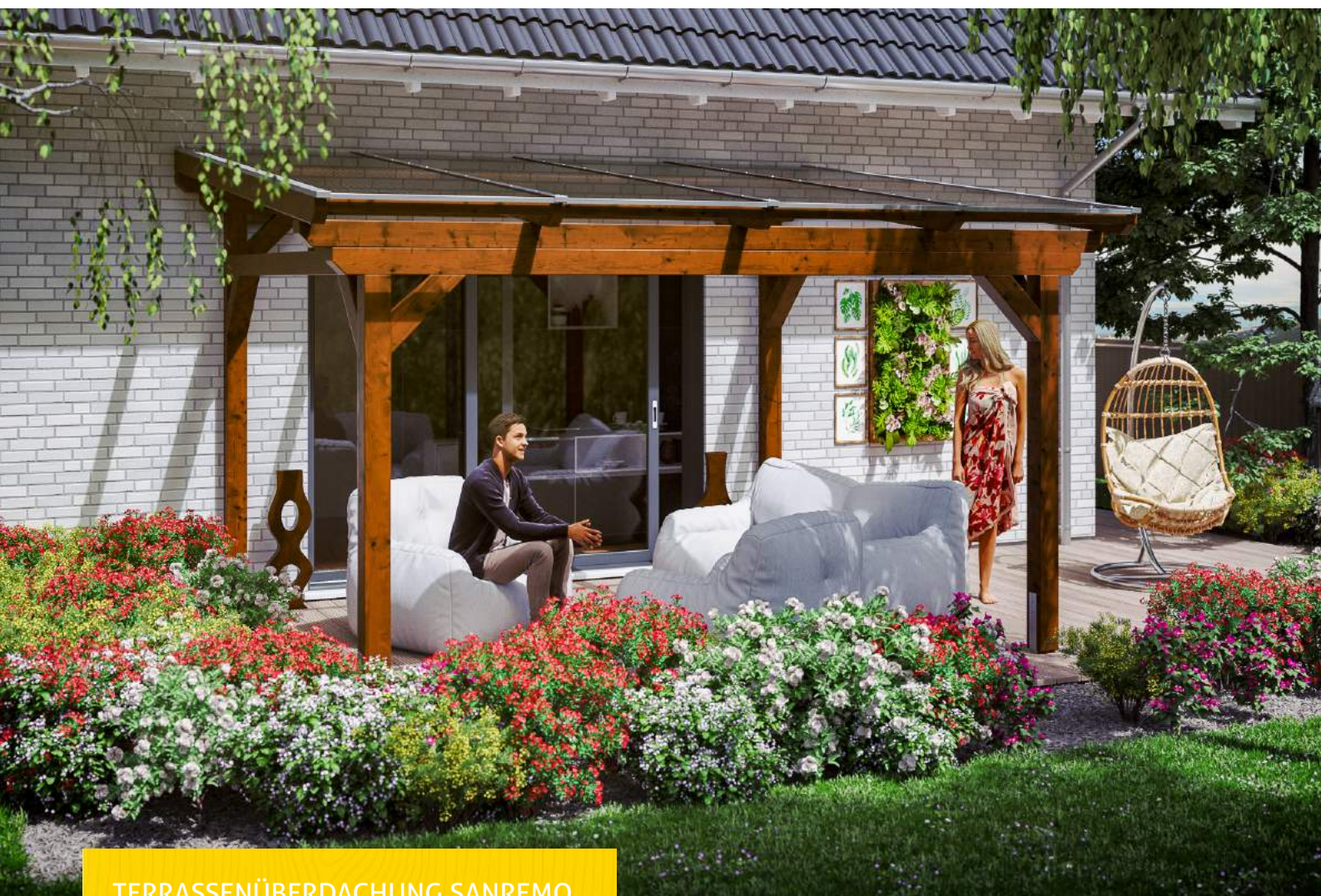
TERRASSENÜBERDACHUNG SANREMO 434 x 400 cm