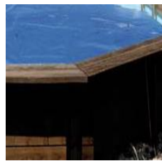
Isothermabdeckplane Isothermic cover 786641