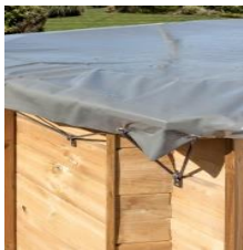
Winterabdeckung Winter cover 788041