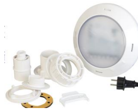
Beleuchtung Lightning PLWPB