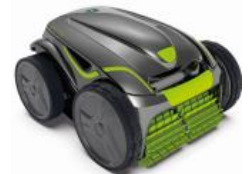
Roboter Robot GV3420 / GV3520