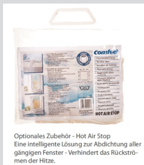
Optionales Zubehör - Hot Air Stop Eine intelligente Lösung zur Abdichtung aller gängigen Fenster - Verhindert das Rückströmen der Hitze.

Midea Europe GmbH Ludwig-Erhard-Straße 14 65760 Eschborn Deutschland +49 (0) 6196 90 20 0 info-meg@midea.com www.feelcomfee.com/de