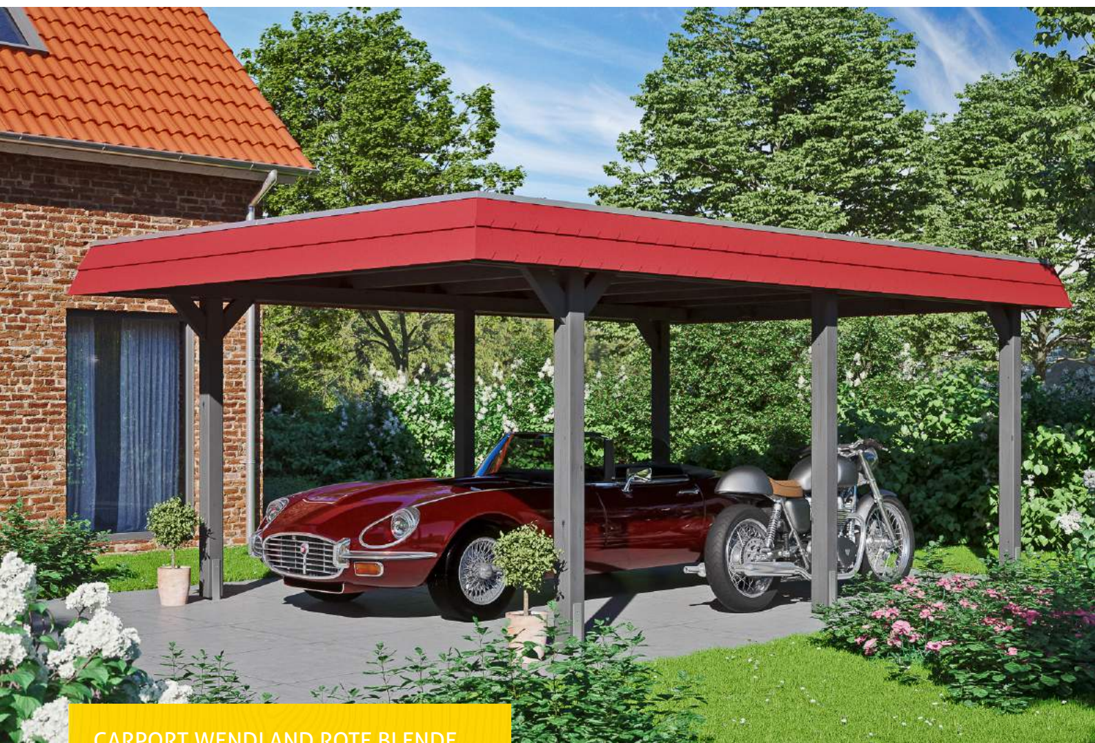
CARPORT WENDLAND ROTE BLENDE 409 x 628 cm