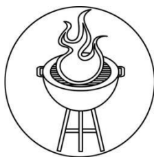
Auf einem Grill