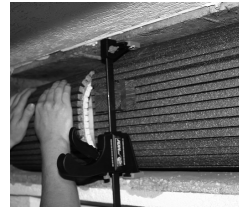
6. Zwischenstücke aufmessen und einsetzen.

WICHTIG: Diese Anleitung vor der Montage entfernen! Die Dämm-Matte muss im gebogenem Zustand in einem Stück (Klemmwirkung) eingebaut werden. Bei unsachgemäßem Einbau (Teilung der Platte in mehrere einzelne Streifen) kann keinerlei Gewährleistung übernommen werden. Eine Montage ist nur bei einer Temperatur ab 5° Grad durchzuführen. Des weiteren muss die Dämm-Matte ca. 24h vor der Montage bei Zimmertemperatur lagern. Weitere Information erhalten sie über ihren Fachhändler oder unter: Tel. 0271/89056-444