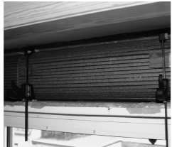
7. Dämmung fixieren! (Spreize oder Dachlatte verwendbar)