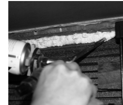
8. Dämmplatte mit Montageschaum (kein Füllschaum) zum Innenbereich umlaufend verkleben und abdichten.