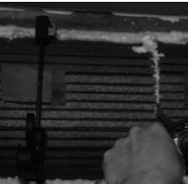
9. Dämmplatten in allen Stoßbereichen sowie zum Mauerwerk mittels Montageschaum fixieren und abdichten.